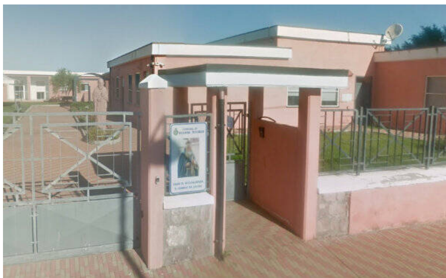
Vista ingresso principale della struttura esistente