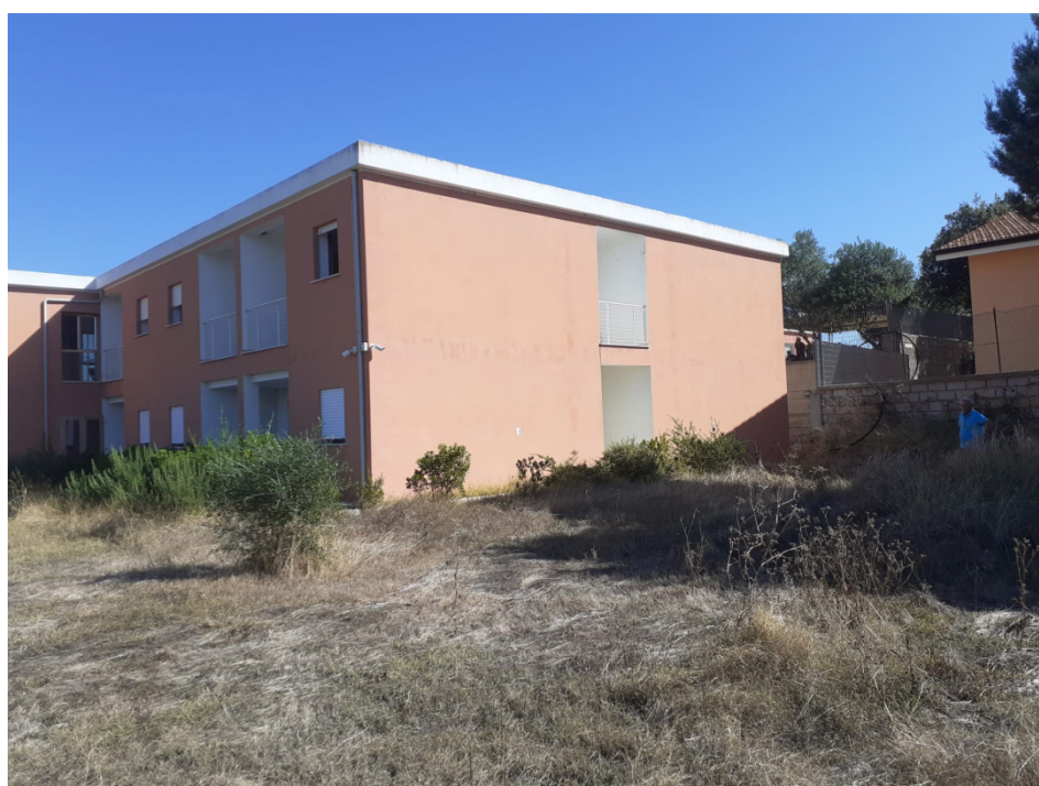
Vista aree oggetto dell'ampliamento