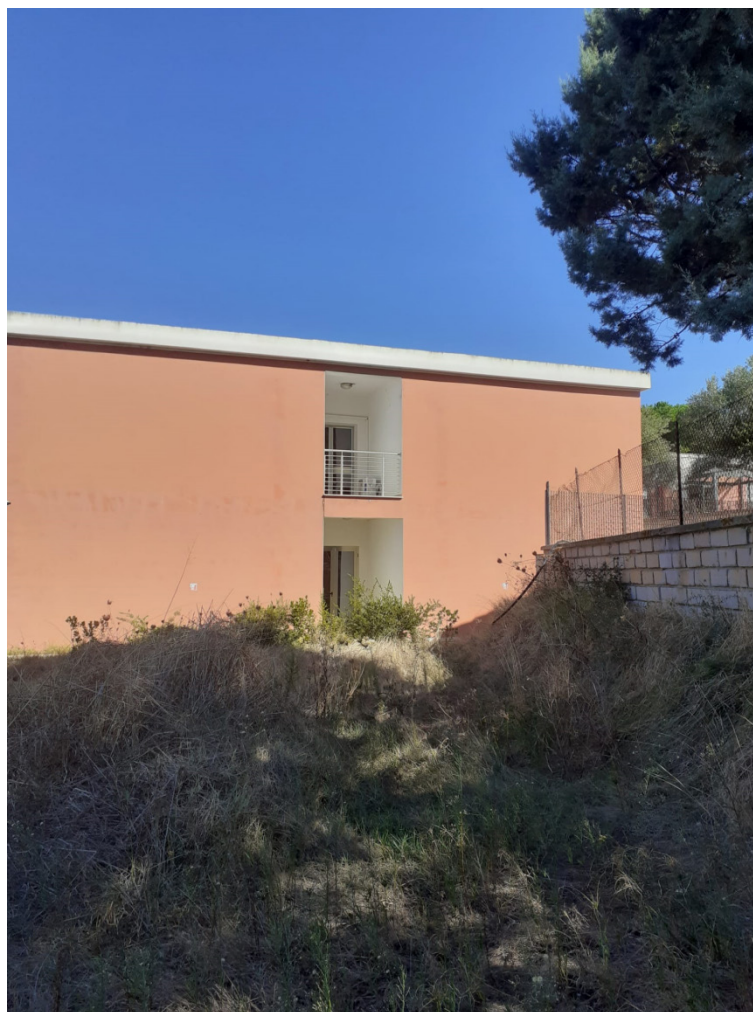
Vista aree oggetto dell'ampliamento